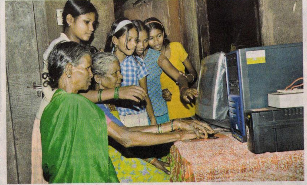
SHARING KNOWLEDGE: Children teaching computer skills to the people of the tribe.

Ten children studying in Stds of time. VII to X of the school have been